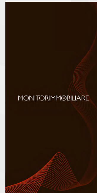
300x600 Half Page

FORMATO: jpeg, png, gif (statica o animata) Link landing page richiesto