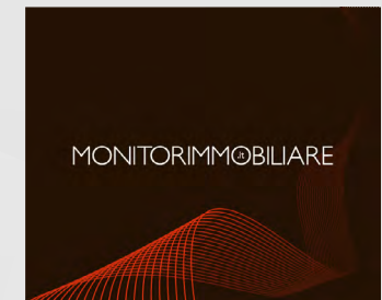
300x250 Medium Rectangle

Per informazioni sulle proposte commerciali si rimanda a eventi@monitorimmobiliare.it